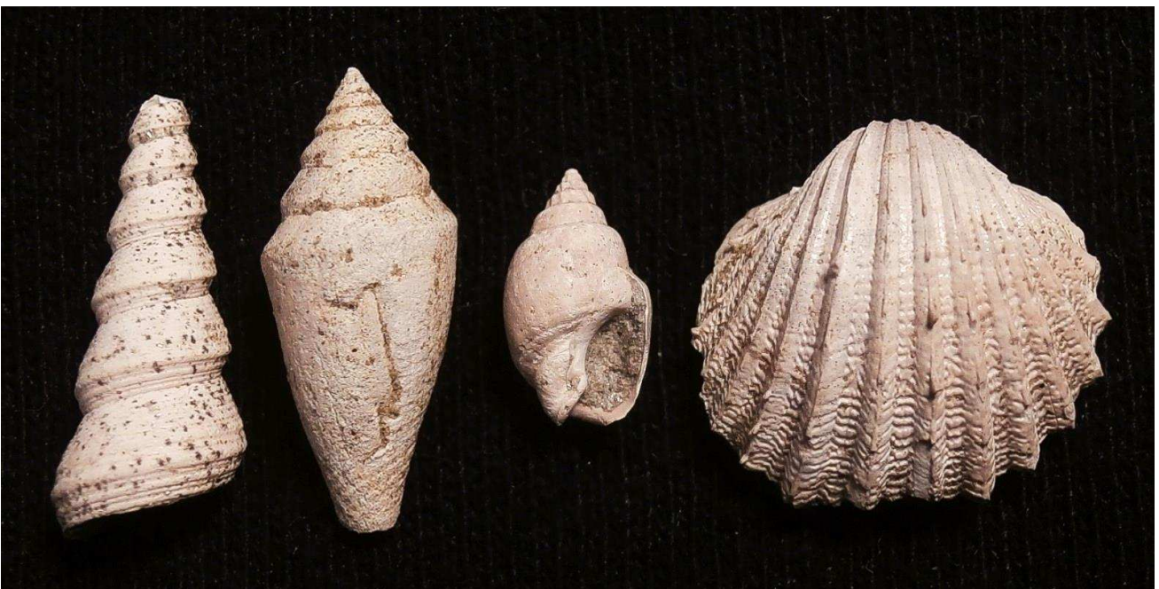
Diverse lose Fossilien, von links nach rechts: Turritella gradata oder T. aquitanica ; Conilithes brezinae , Höhe 13 mm; Sphaeronassa schoenni , Jungexemplar; Acanthocardia paucicostata .