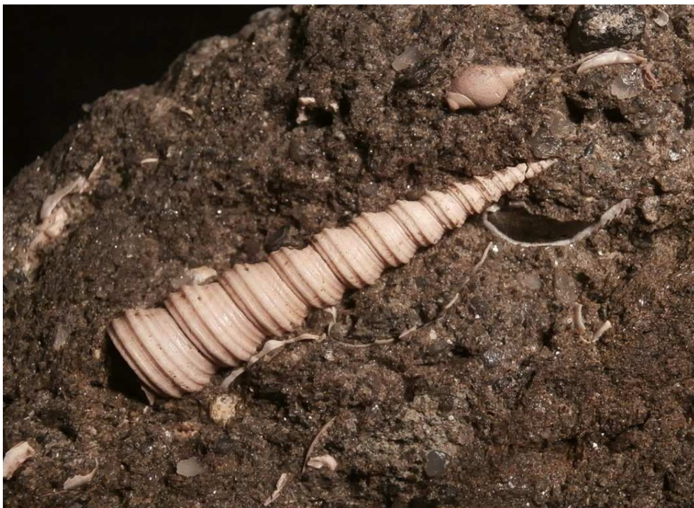
Turritella partschi mit jungem Exemplar von Sphaeronassa schoenni . Länge der Turritella 22 mm.