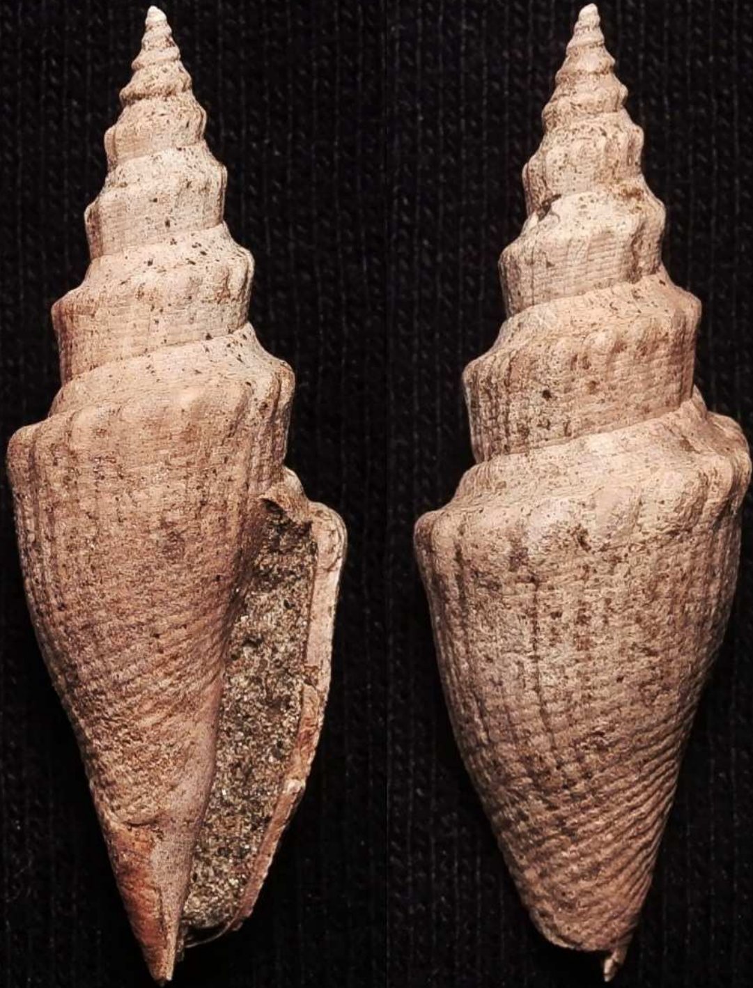
Genota elisae (Hoernes & Auinger, 1891) "Florianer Schichten", Styrian basin, Eastern Alps Langhian/Badenian, Miocene Höllerkogel-4, St. Josef, Styria, Austria Collected 10/01/2019 Height 28 mm