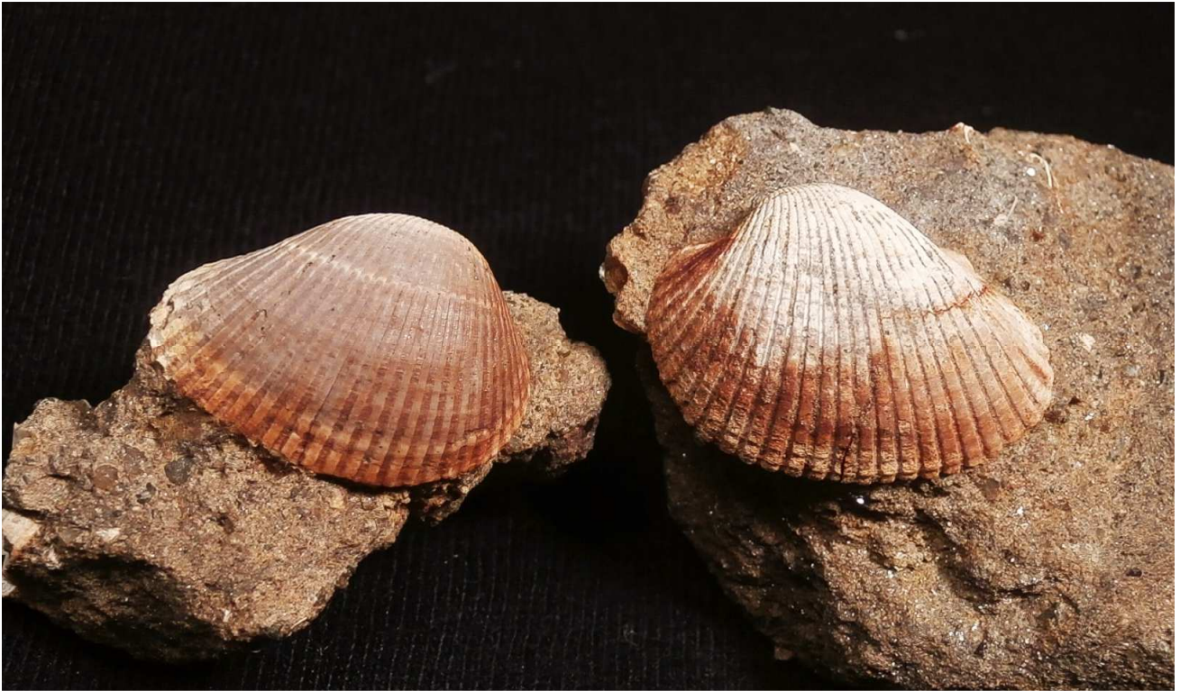
Anadara diluvii . Größe der Muscheln jeweils 17 mm.