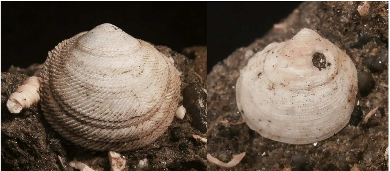
Links: Divaricella ornata . Größe 12 mm.