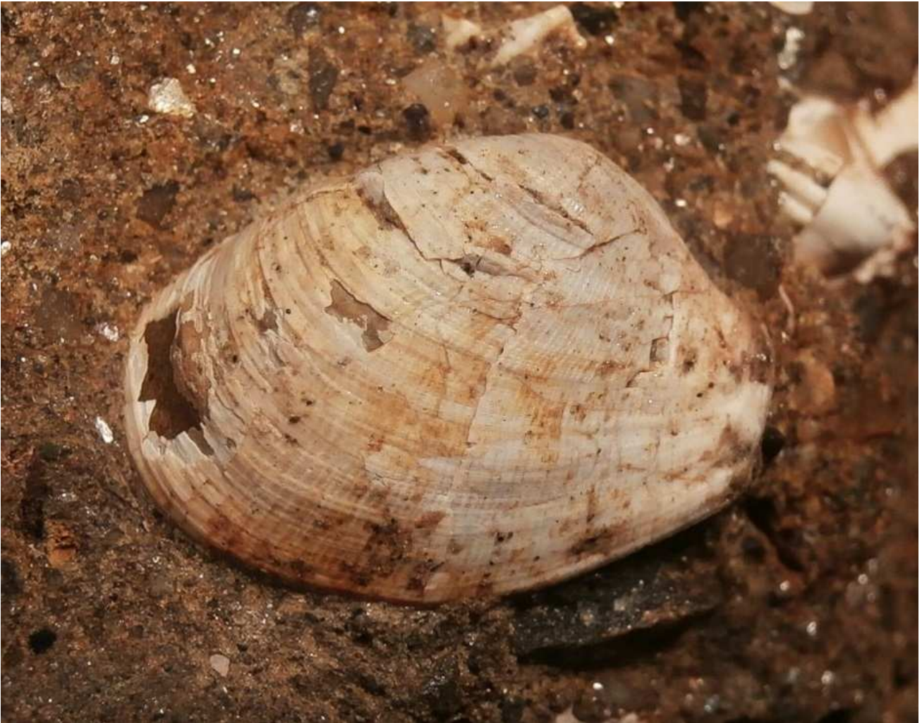
Tugonia anatina , nicht komplett erhalten. Größe 14 mm.